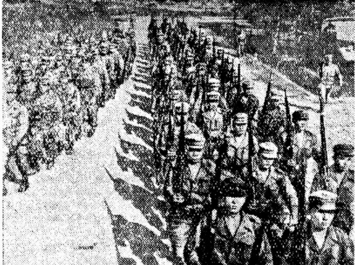
Подразделение корпуса направляется на маневры. Во время маневров «полицейские», которых начальники штаба американской армии Коллинс уподобил «простым регулировщикам уличного движения», обучаются таким необходимым для управления уличным движением вещам, как преодоление водных преград, стрельба из тяжелых орудий...