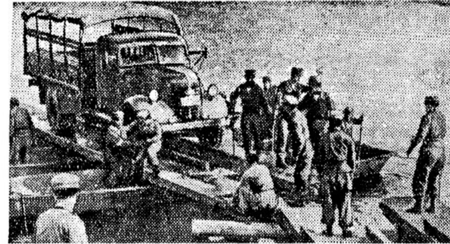
На снимке: понтонеры «полицейского резервного корпуса» маводят мост.