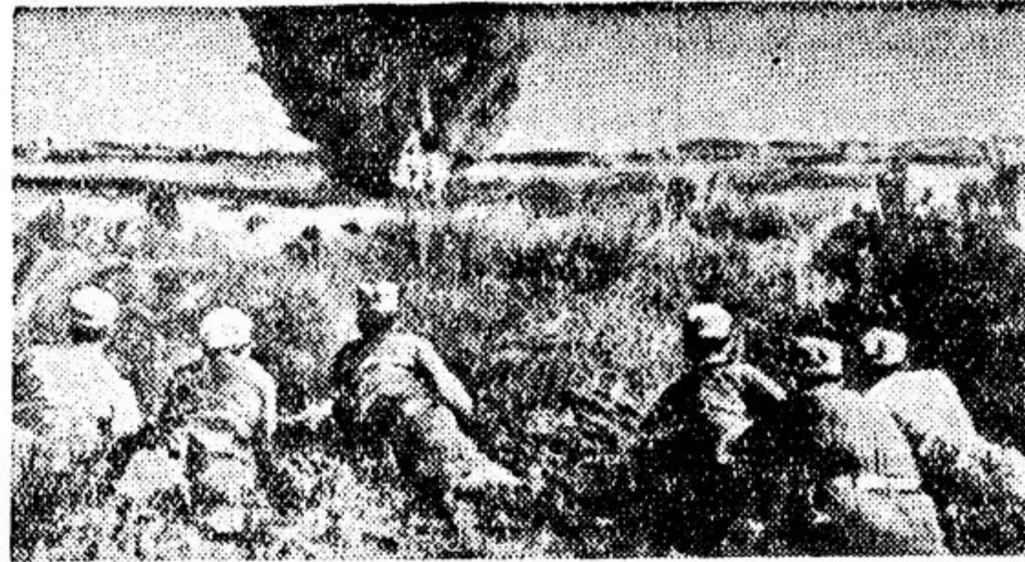
Американские и японские официальные врали утверждают, будто бы на вооружении «полицейского резервного корпуса» нет артиллерии. На снимке: маневры «полицейских» с применением тяжелых орудий.