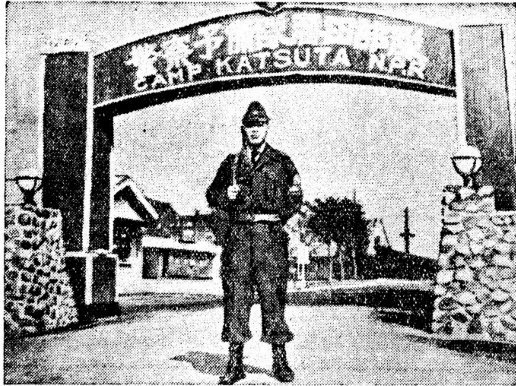
Лагерь «полицейского резервного корпуса» в Кацута. По всей стране разбросано 50 таких лагерей. Молодчик в американском обмундировании, американских ботинках и с американским карабином за плечом, несущий охрану у входа, прошел тщательную проверку «лояльности» по новейшей американской методике, прежде чем быть зачисленным в корпус.