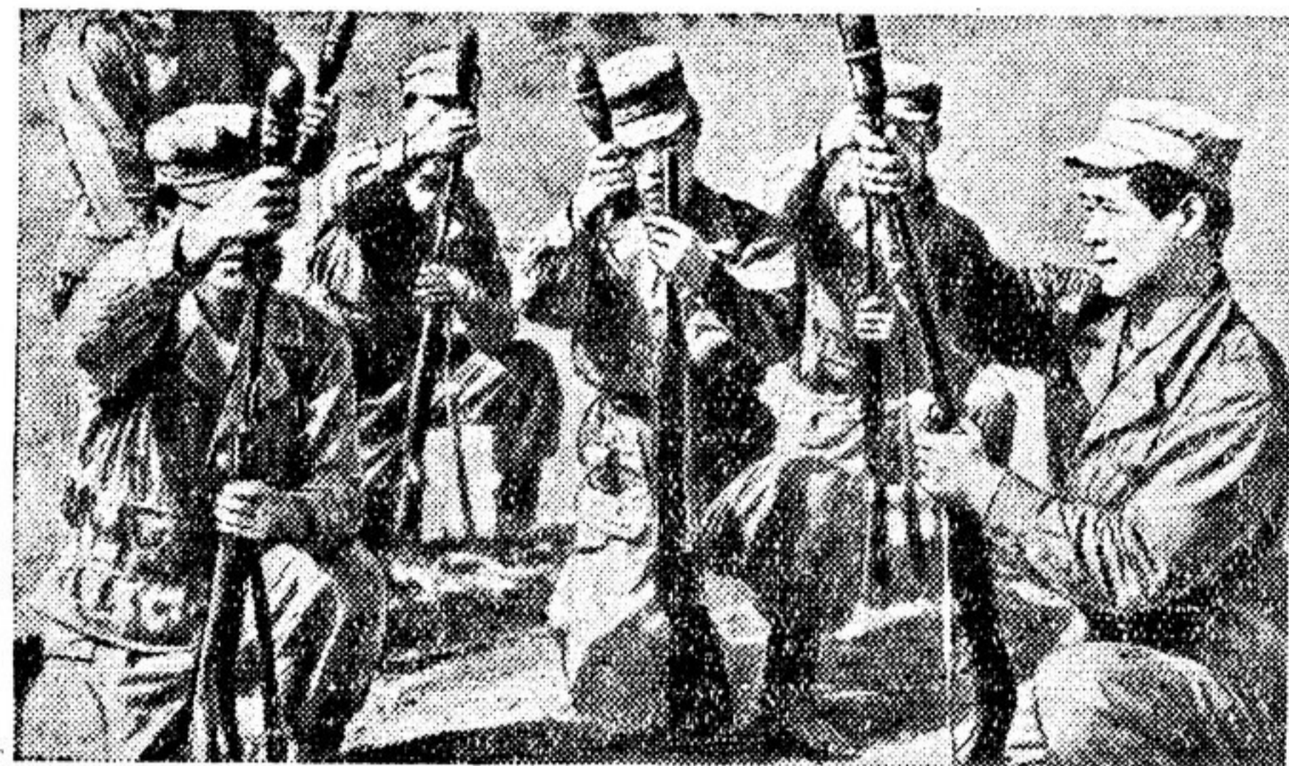
«Японцам, — пишет американская газета «Газет энд дейли», — не приходится из-за отсутствия снаряжения использовать деревянные пулеметы и бронежилеты из пальмаше». США в изобилии снабжают замаскированную японскую армию вооружением. На снимке — практическое изучение нового противотанкового оружия.