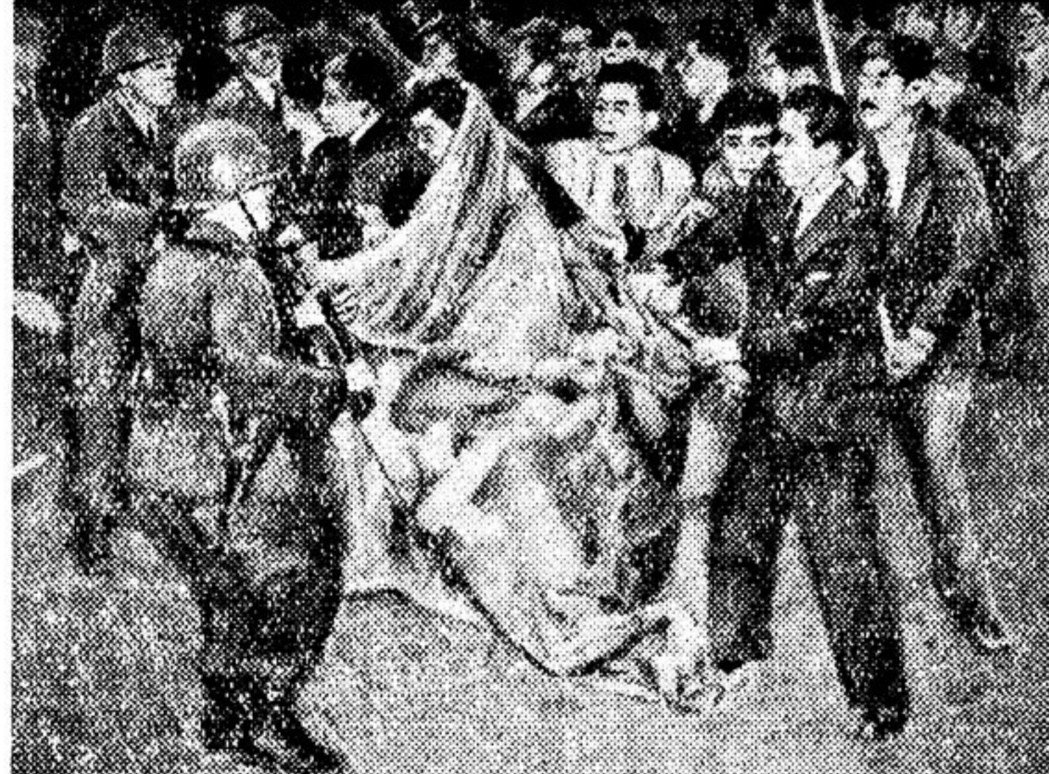
А вот японская полиция (не «резервная», а просто полиция) за последней работой: разгоняет демонстрацию трудящихся Токио, выступающих против превращения Японии в военную базу и колонию американского империализма. Но, несмотря на кровавый террор оккупантов и их японские пособников, сопротивление японского народа растет и крепнет!